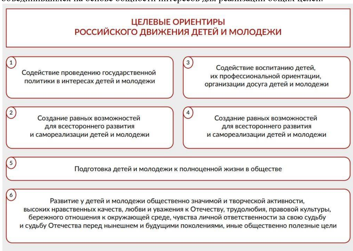
Рис. 2. Целевые ориентиры РДДМ (ФЗ № 261 от 14.07.2022: ст. 2, п.1)

В настоящее время история развития детских общественных объединений открывает свою новую главу. Сами участники детского движения выбрали название – «Движение Первых». Они же определяют основные направления и содержание деятельности Общероссийского общественно-государственного движения детей и молодежи, придумают игры, в которые будут играть, традиции, которые захотят соблюдать, свою систему личностного роста и самореализации, свои отличительные знаки, символы, ритуалы и вдохновляющие девизы– это добровольное детско-юношеское объединение обучающихся МБ ОУ «Октябрьская СОШ» с. Рыбного, созданное по инициативе детей и взрослых, объединившихся на основе общности интересов для реализации общих целей.